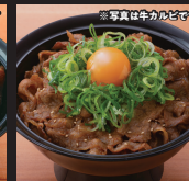
ねぎたま牛カルビ丼