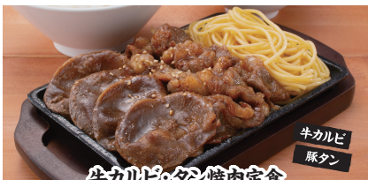
牛カルビとタン焼肉定食