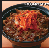
キムチ牛カルビ丼