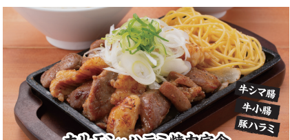
ホルモンシマハラミ焼肉定食