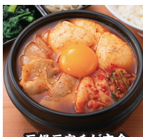
石鍋豆富チゲ定食