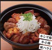
旨辛ホルモン・ハラミ丼