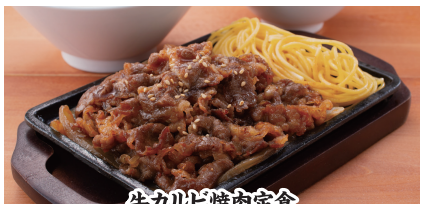
牛カルビ焼肉定食