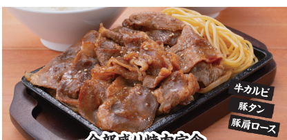
全部盛り焼肉定食