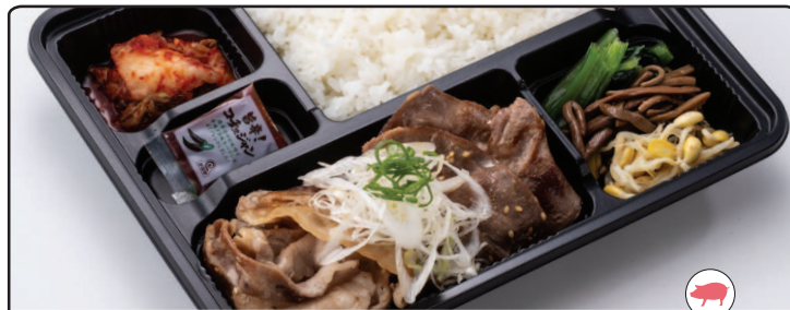
ねぎ塩豚カルビ タン焼き弁当