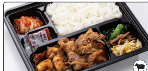
カルビ・ホルモン焼き弁当